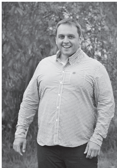
"Budu pokračovat v odporu proti tlakům města na další masovou výstavbu."

OPM je zřejmě to nejzajímavější, co mě dosud v životě potkalo. Stále mě udivuje, kolik nezištných, šikovných a zapálených lidí je ochotných fungovat jen na bázi nadšení a víry, že společně usilujeme o správnou věc. V tomto směru musím říct, že mám na spolupracovníky veliké štěstí a je pro mě ctí, že si mě vybrali, abych je na radnici reprezentoval. Lidí ochotných dělat něco navíc je v Medláňkách hodně. Tyto lidi by mělo OPM sdružovat a díky vzájemné spolupráci využívat jejich potenciál k obohacení kvality života v Medláňkách. Angažmá OPM ve volbách a na radnici vidím jen jako nástroj k naplňování tohoto cíle. Rád bych tedy viděl OPM organizující společenské, sportovní a kulturní akce, OPM informující o naší MČ, OPM vstupující do správy věcí veřejných, OPM zastávající zájmy naší MČ vůči městu a OPM otevřeně dalším lidem, kteří chtějí pro Medláňky dělat něco navíc.